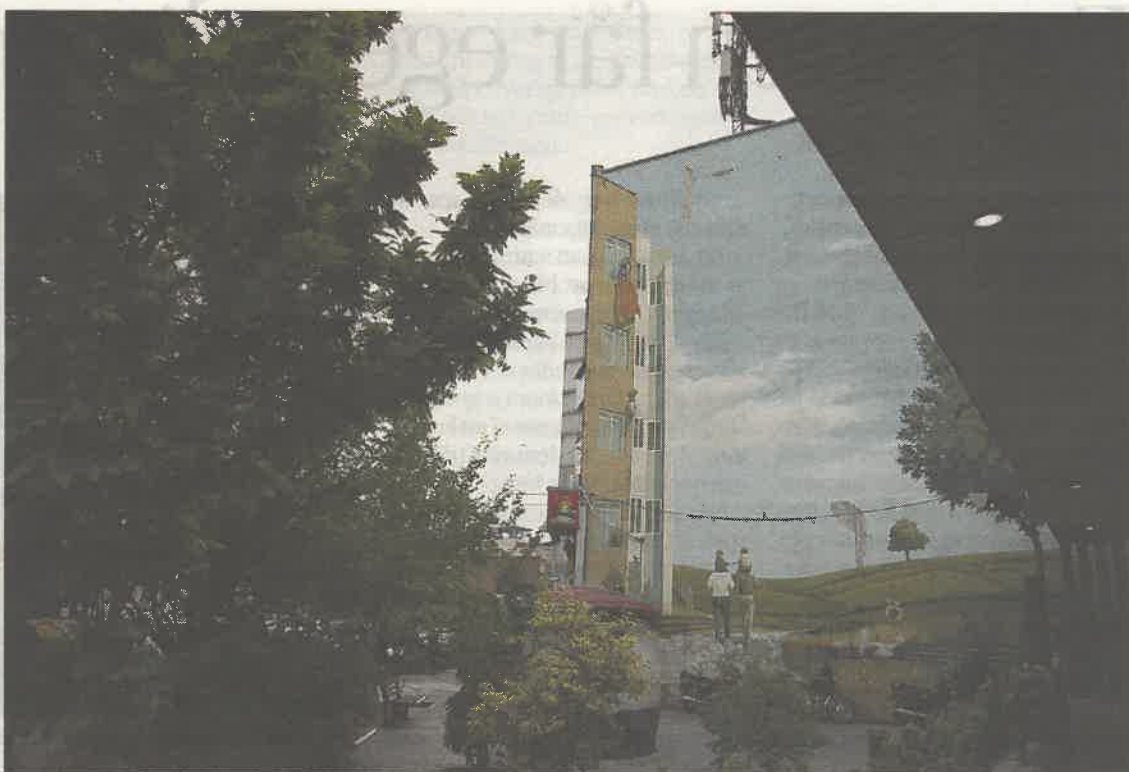
Två väggar målade av Mehdi Ghadyanloo, från Teheran (ovan) och Linköping (nedan).