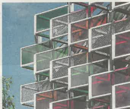
Balkonger och solceller på multihuset Flustret.

Vallastadens "bo- och samhällsexpos" signum har blivit variationen. Stilbrott och materialkrockar. Knixiga gatunät och stort och litet om vartannat. Betonggrått och medelhavsblått. Byggherrar och arkitektkontor likaså av skiftande kali-