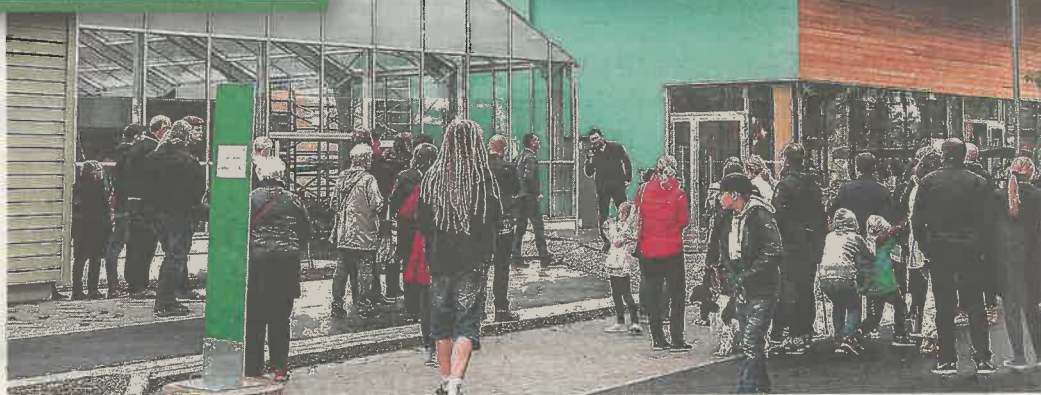
Stilbrott och materialkrockar är Vallastaden 2017:s signum.