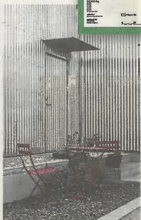
Fasad i korrugerad plåt.