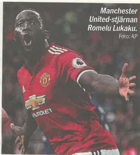
Manchester United-stjärnan Romelu Lukaku.